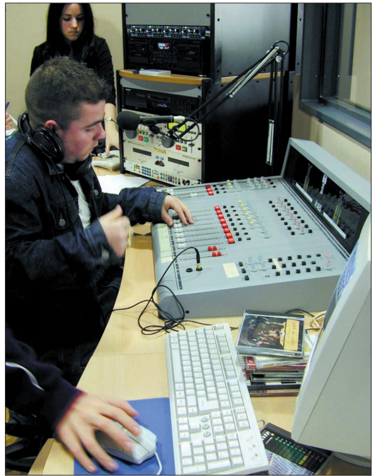
El Prat Ràdio va començar les seves emissions el 23 d'abril passat

El jovent i les entitats tindran un protagonisme especial a la ràdio "ja que la seva aportació serà indispensable", afegeix Óscar Sán-